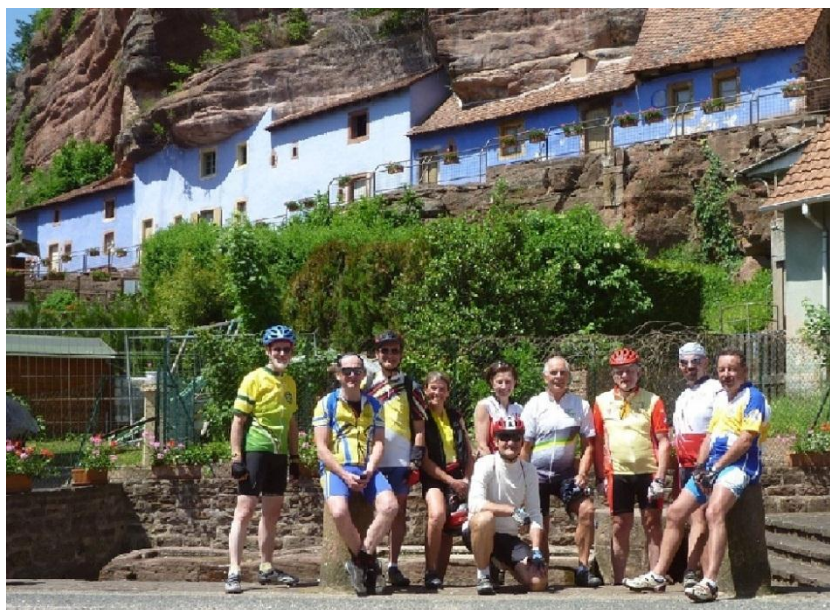
Pause bienvenue au pied des maisons troglodytes.

Après le passage à Phalsbourg, nous nous sommes posés du côté de Graufthal au pied des maisons troglodytes pour le pique-nique de 13 h. Ce fut un moment très gai et convivial. Nous avons récupéré une grande poubelle pour poser l'appareil photo à retardement de John afin d'immortaliser tout le petit groupe. Ce fut une bonne partie de rigolade.