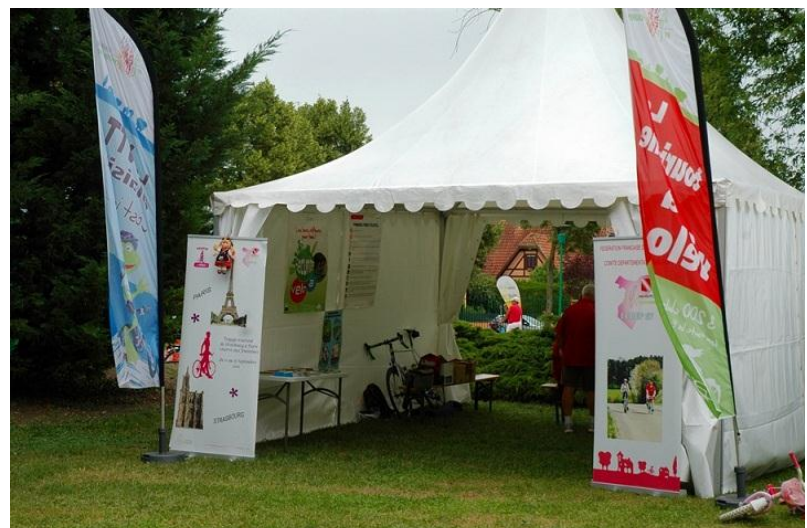
Un petit air de camp romain