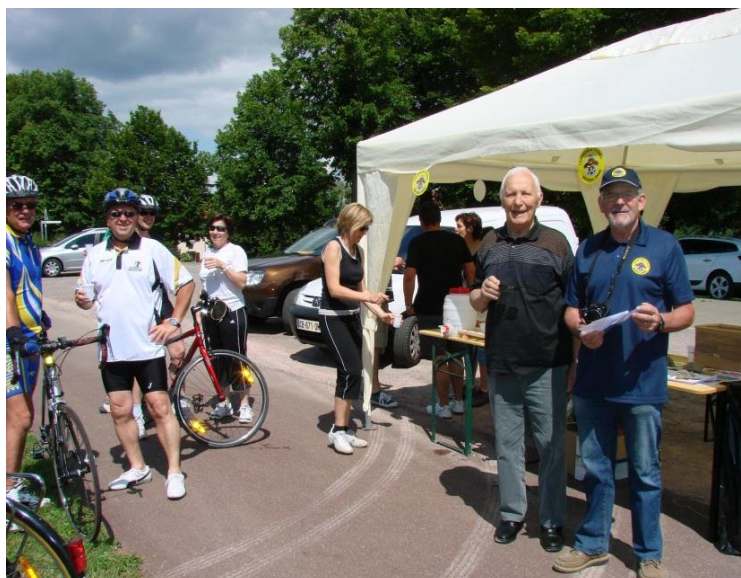
Point accueil « rafraîchissement » bienvenu A Brechlingen.

Côté loisir, un exposant de bicyclettes a proposé d'essayer un vélo route équipé d'un dérailleur électrique. Un organisateur de séjours a permis de découvrir de nombreuses destinations consacrées au vélo.