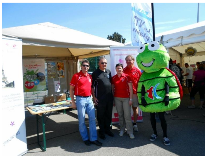
Les membres du comité en compagnie de la Coccinelle DD.

Après celle de Woerth et avant celles de Lorentzen et de Marckolsheim, ce fut au tour de Marlenheim d'accueillir les « cyclos et cyclotes » du centre du département. Cette manifestation a réuni de nombreux cyclistes impatientes de découvrir les pistes qui feront leur bonheur pour des promenades seuls, en groupe ou en famille.