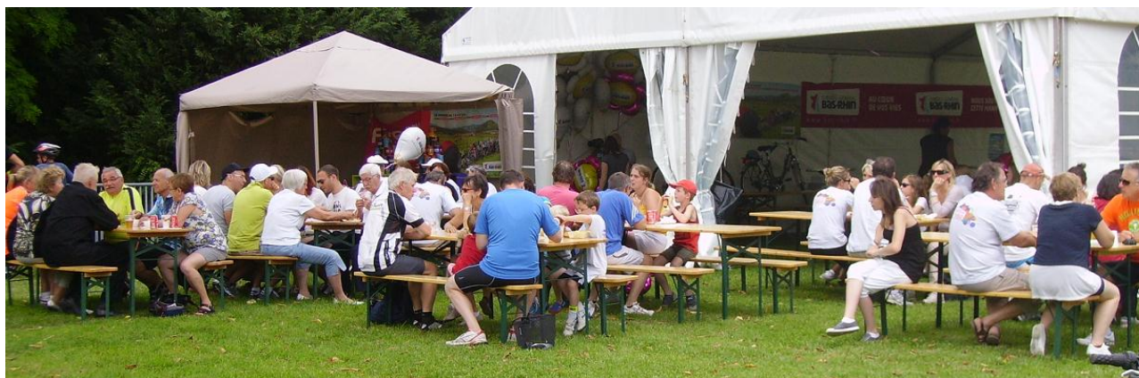
Un public nombreux en fin de matinée.

C'est dans un parc en lisière de commune qu'ont été dressées les tentes où les différentes attractions ont pris place. Le lieu était idéal pour ce type d'événement, ombragé, verdoyant et assez vaste, tout le monde a facilement trouvé ses marques, même si la disposition de certains équipements n'était pas propice à une bonne circulation du public.