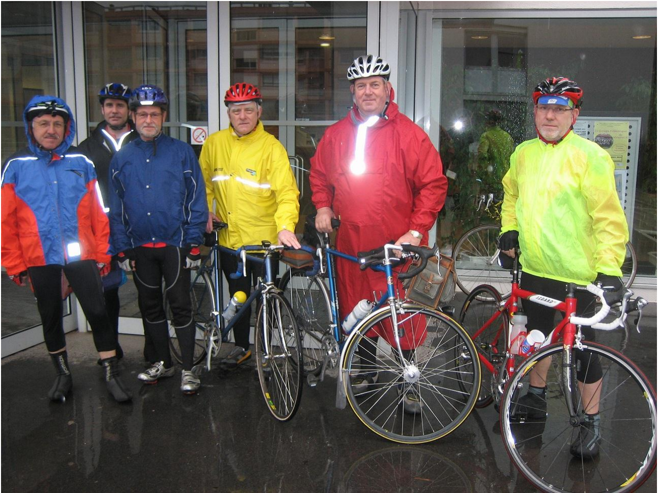
A l'abri en attendant une hypothétique éclaircie.