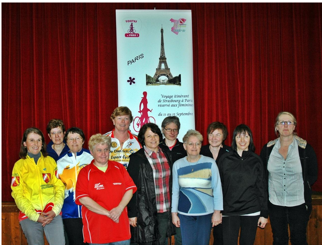
Des féminines engagées sur le VI de Toutes à Paris ont démarré leur saison en soutenant le handicap.

Une fois encore, la générosité exprimée avec le soutien des maires de Schoenenbourg et de Soultz-sous-Forêts, du groupe théâtral de Schoenenbourg et de jeunes du village, ainsi que des Coureurs de la Saline, permettra de répondre « présents » au rendez-vous d'octobre avec nos amis du Centre de Réadaptation Fonctionnelle Clemenceau.