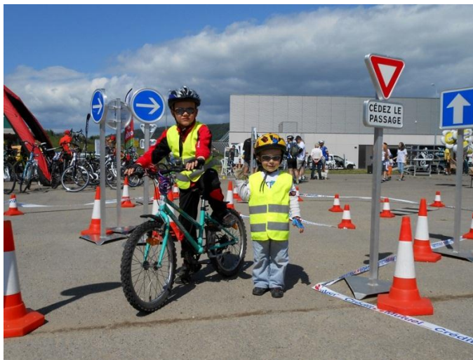
Parés pour le circuit sécurité.

Dès 10 h 15, les jeunes candidats se sont présentés au départ du mini circuit de sécurité. Avant de s'élancer en vélo sur le parcours, ils l'ont reconnu à pied en compagnie de Marcel qui leur a expliqué la signification des différents panneaux routiers.