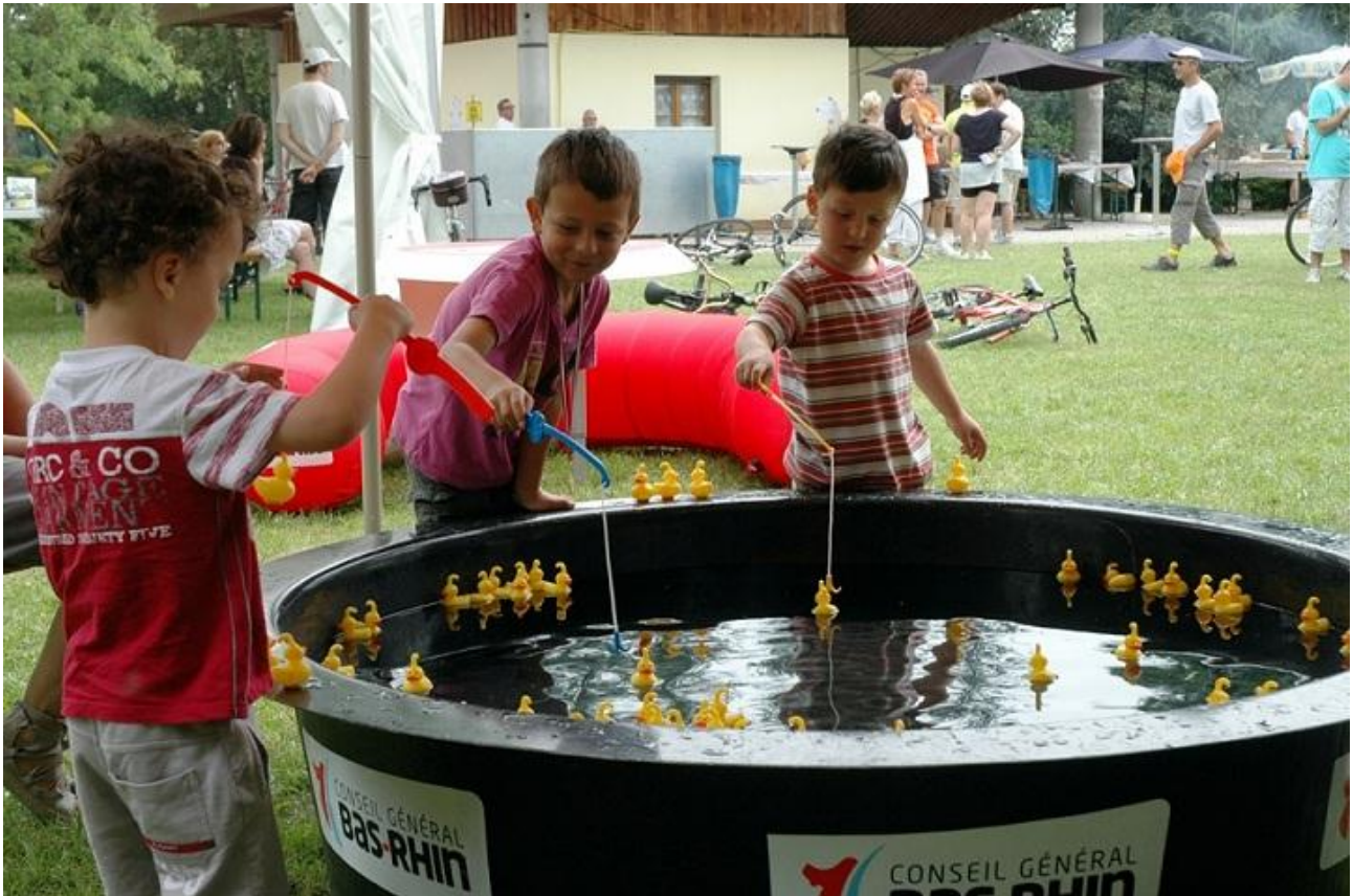
La pêche aux canards était très prisée par les jeunes.

Le public était présent tout au long de la journée, sans pic d'affluence sous un ciel devenant de plus en plus nuageux, mais, qui heureusement, n'a laissé échapper que quelques gouttes de pluie en toute fin d'après-midi.