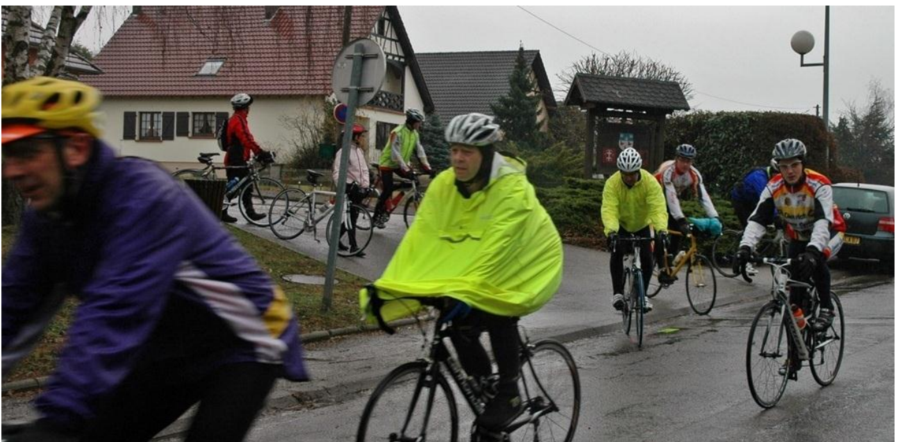
La pluie n'a pas découragé ces cyclos.

Lorsqu'après une semaine printanière, douce et ensoleillée, le dimanche boit le bouillon avec ce zeste de vent qui refroidit la soupe, l'organisateur redoute au départ l'assaut des réclamations. Or il n'en fut rien à Schoenenbourg où l'on fit bon cœur contre mauvaise fortune.