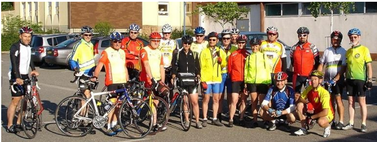
Le groupe au départ.